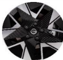
16" diamantem broušené disky z lehké slitiny