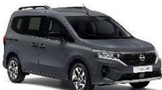
KPW Šedá Urban (7 000 Kč)