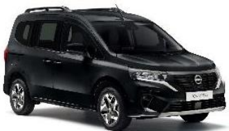
GNE Černá Enigma