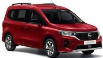
NPF Karmínově červená