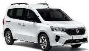
QNG Bílá (bez příplatku)