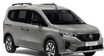
KNG Šedá Casiopee