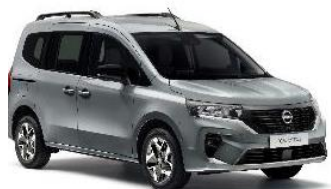
KQA Šedá Highland