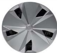
16" plné disky